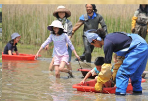
れんこん田で泥遊び