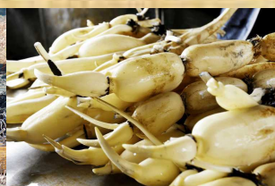
収穫したれんこん

主催: 島田島れんこん塾 事務局 ☎ 088-689-0204 fax 689-0213