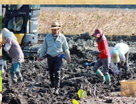
れんこん収穫風景