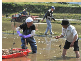
れんこん植付風景